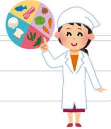
ひまわりカード(6/19～23実施)による朝食摂取調査結果