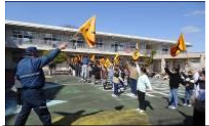
2月28日(水)新班長登校旗指導