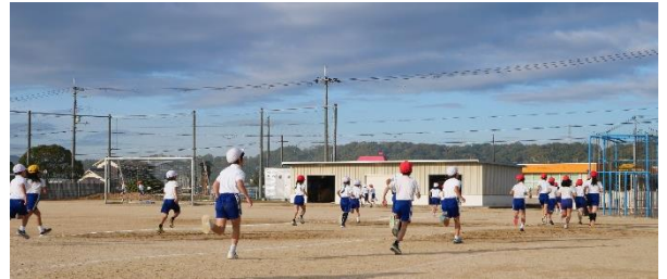
朝の元気アップマラソン

今年も残すところ1か月となり、朝夕の寒さも厳しくなってきました。そんな中、子どもたちは11月11日(月)から朝の元気アップマラソンに毎日取り組んできました。朝の準備を終えた子どもたちが三々五々教室を飛び出して運動場に出てきます。それぞれのペースで自主的に運動場を走り始めます。この光景が私は好きで、子どもたちの主体性や仲間意識を育てる良い機会だと感じています。8時10分から準備運動が始まり、その後5分間自分の限界にチャレンジすべく一生懸命トラックを走る姿が見られます。真っ赤な顔で「今日〇周走ったで!」と報告してくれる子どもたちを大いに褒める毎日です。