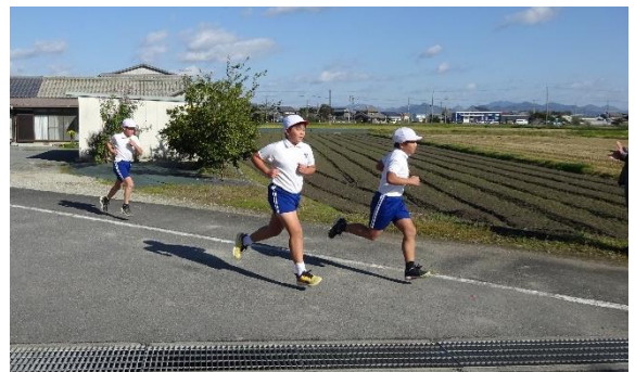
マラソン大会 農道を走る

表情で、苦しさやしんどさと闘いながら走る姿はみな輝いていました。しんどいことから逃げずに、自分の限界にチャレンジし、友だちを応援したこの経験、味わった達成感や充実感は、人生の中でも大変価値のあるものだと思います。ここで得た自信をこれからの学校生活の中で大いに活かしてほしいと願っています。