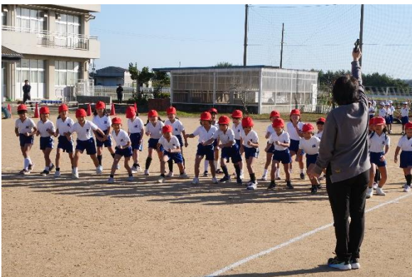
マラソン大会 スタート

11月28日(木)のマラソン大会では、子どもたちの頑張りに対し、保護者の皆様や地域の皆様の温かいご声援をいただき、感謝申し上げます。また、PTA 保健体育部、学級委員の皆様には立ち当番等で大変お世話になりました。本当にありがとうございました。