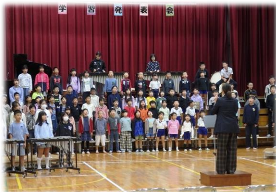
11/3 (金) 学習発表会