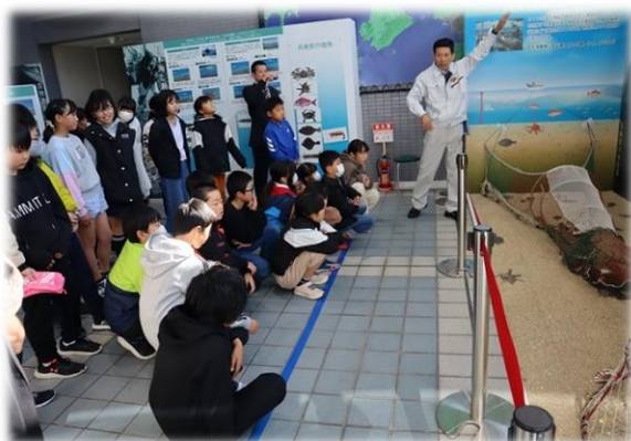
11/21 (火) 校外学習 5年