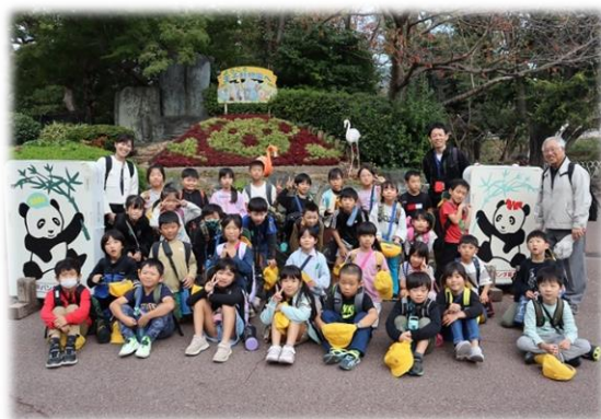
11/9 (木) 校外学習 1・2年