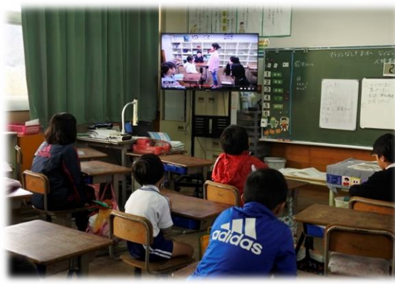
11/24 (金) 人権集会