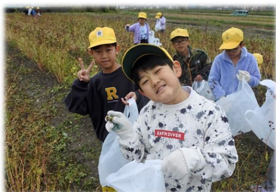
11/15 (水) そばの収穫 3・4年