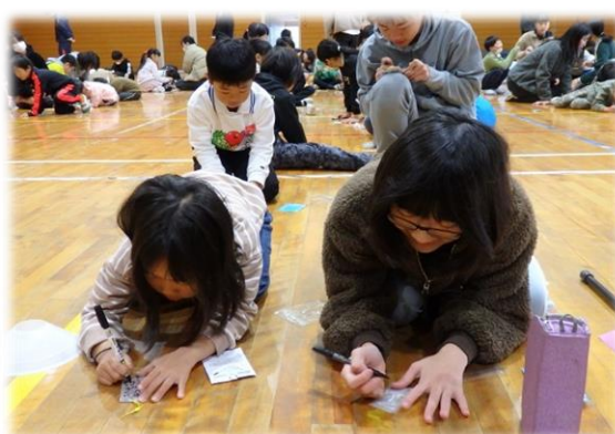
11/20 (月) 交通安全反射板づくり