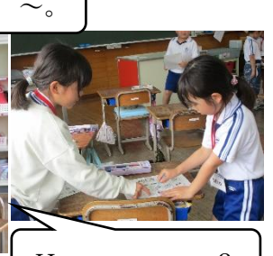
How are you?