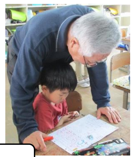
I am ~。