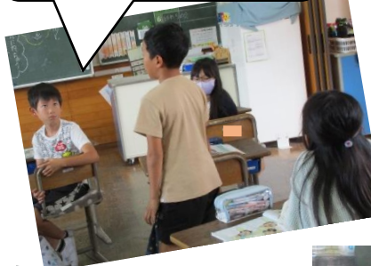
振り返ってみよう