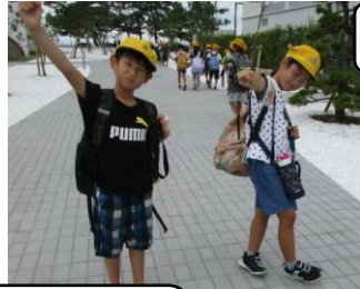
ありがとうございました