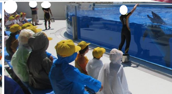
とても強い日差 し。汗びっしょ り。それでも前 列で大はしゃぎ で楽しむ子ども