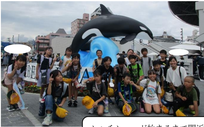
シャチショーが始まるまで間近で見て大喜びしている子どもたち。