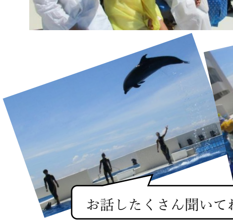
お話したくさん聞いてね