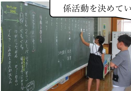
係活動を決めています