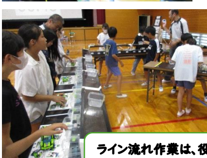
与えられた作業に意欲をもって取り組む姿