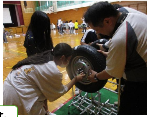
組立工程で、タイヤを取り付ける作業です。