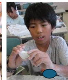
勾玉づくり。 無言で集中して取り組んでいます。