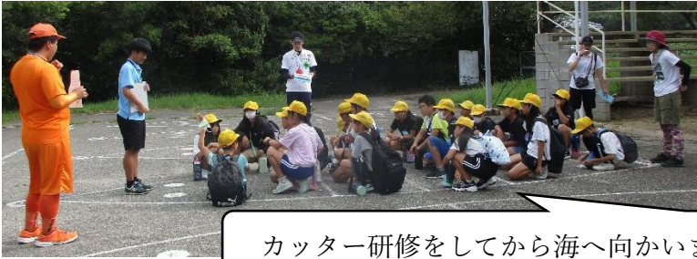
カッター研修をしてから海へ向かいます

来住小学校は地域の方の協力を得て、文化を体験から味わっていることに感謝ですね。そのような中でも、さらに海の近くで自然学校を4泊5日で行い、体験をしている子どもたち。体験から自身の生へ結び付けて考え、心と行動をさらに今後つなげていきましょう。