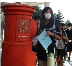
家族への手紙を書き、自分の手でポストへ投函