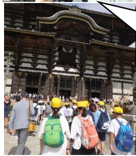
事の前には必ず説明