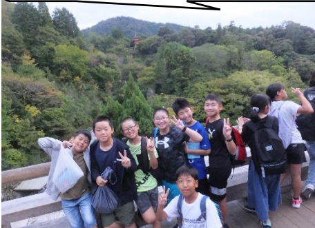
清水の舞台から飛び降りる覚悟で決断を下す実感