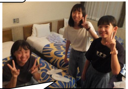
待ちました！「ようやくお部屋へ