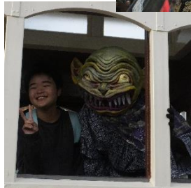
最後の太秦映画村では、思いっきり楽しみました。