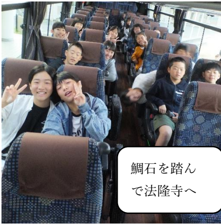
鯛石を踏んで法隆寺へ