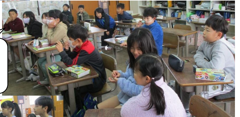
前に集まり、見入って、聞き入って