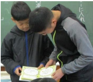
読み聞かせは 心があったか くなる時間