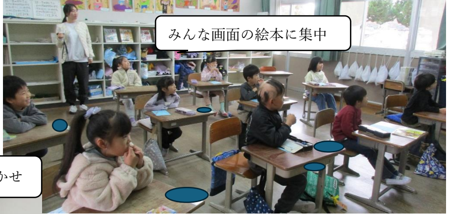
みんな画面の絵本に集中