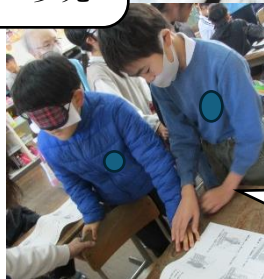
ここに椅子、ここは机