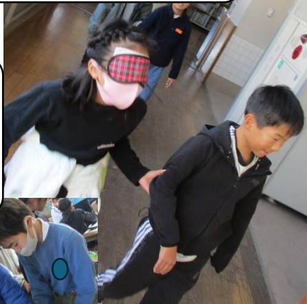
コーデイナーが一步先