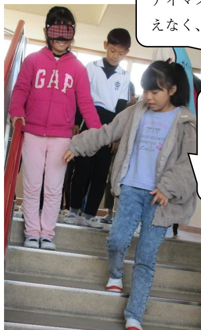
アイマスクを身に着けると真っ暗で何も見えなく、不安がいっぱいになった子供たち