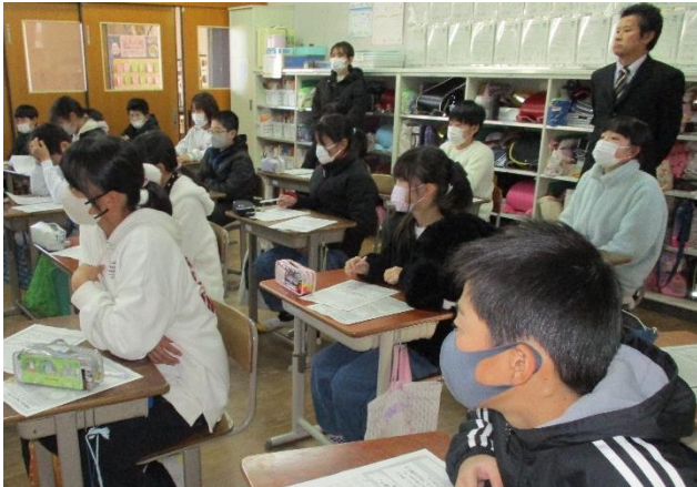
SCの先生と「心のサポート」授業

地域の方から「少人数とは思えないほどの迫力があり、パワーがいただけた音楽会でした。」と言葉をいただきました。さあ、音楽と国語の物語はとても似ていることに気づいていますか。人物の人柄、品格を表したり、情景の美しさを象徴したりしています。音楽は、理屈や知識などとは無関係に心の深いところへ直接響いてくるように思います。2学期の音楽会で得た学びを3学期も生かして学び続けることができるために、たまには行事を再度振り返ってつなげながら学習してみるのもいいですね。