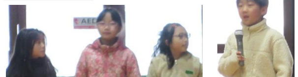
コロナが流行し、4月から休みになった時は【2年】