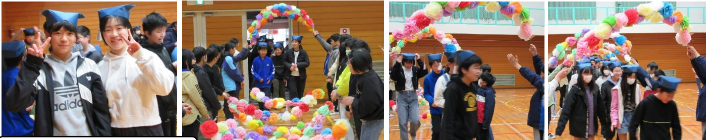
新児童会が開く6年生を送る会

人はとても複雑です。自分の思い通りにはいかないことは日常茶飯事です。失敗もたくさんあります。乗り越える気持ちさえあれば、成長をどんどんしていきます。自分に都合の良い未来を描かず、結果的には面白い、思い通りにならない生き方がほとんどだろうと思います。だからこそ、何事も恐れず、不安がらず、行動して失敗をどんどんする人であり、人生を楽しむことが一番です。