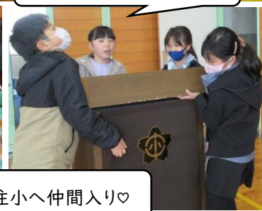
来住小へ仲間入り♡