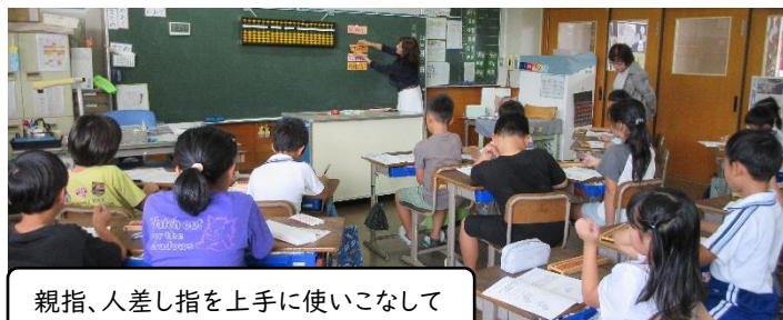
親指、人差し指を上手に使いこなして

たくさんの人と思想や属性を超えて仲良くできる人は、ピンチの時に誰かが救ってくれます。相手を職業や国籍等で見下さない。会話の中で質問ができる人になりたいものです。質問は相手に気持ちよく話してもらうための贈り物です。「今、何にはまっていますか」「何が好きですか」相手の話を否定せずに聞いていくと視野も人間関係も広がり、支えてくれる人が増える。こんな力を育てたいですね。