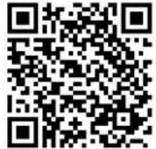
動画サイトQRコード

※ 携帯の場合は、QRコードを読み取ったサイトの一番下にある 「体育保健課学校体育班映像サイト」をクリックしてください。