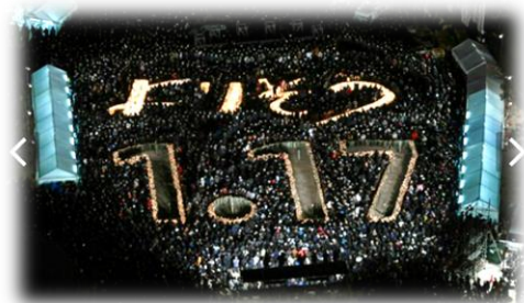
▲ 昨年の「1.17の集い」(神戸東遊園地)

今年は、1月16日(金)に「本気の避難訓練」と「震災に寄り添う追悼集会」を行います。ご家庭でも、このタイミングを大切にいただき、家庭・地域における「防災・減災」について、家族で話し合う時間を持っていただけたら幸いです。