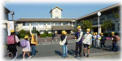
4月19日（火）初日の様子

19日（火）朝の登校時から、「あいさつのスター☆になろう！」のスローガンのもと児童会役員による朝のあいさつ運動が始まりました。日に日に声が大きくなっていますし、なによりみんな元気よく、「今日一日がんばるぞ！」という意気込みが伝わってきます。私も声が大きい方なのですが、子どもたちの元気に負けそうです。（笑）