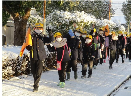
雪景色の中、登校する子ども達

1月25日の朝、全国的に雪が降った日。雪景色の中、子ども達がいつもより嬉しそうな顔で登校してきました。あの大寒波が過ぎ、早いもので2月となりました。桜の芽が膨らみ、時折、間近の春を感じる季節となっています。新1年生の1日入学や6年生の中学校1日体験と、春に向けての行事も予定しています。