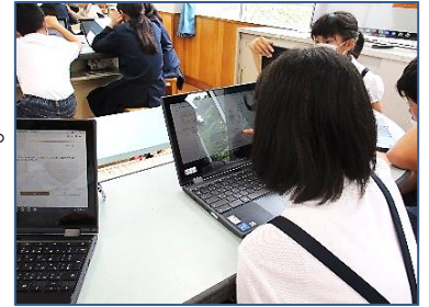
↑ タブレットPCを使って

稲田が金色に波打つ実りの秋を迎えました。2学期は、緊急事態宣言下で始まりましたが、慎重に教育活動を継続し、9月17日（金）には子どもたちが初めて一人一台端末を持ち帰りました。ご家庭では接続できるかどうか確認いただき、ありがとうございました。小野市では、基本的に端末の活用は学校のみとしていますが、今後長期にわたる休校や学級閉鎖等の緊急時に活用できるよう、学年に応じて練習を重ねていきます。