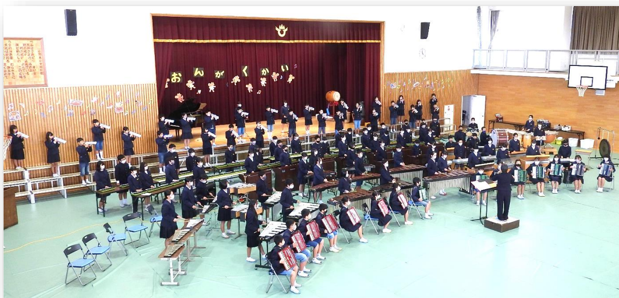
6年生合奏「彼こそが海賊」

11月27日（土）令和3年度小野東小学校きらめき音楽会が行われました。運動会と同じく、2年ぶりに開催することができた音楽会。学校中がよろこびに満ちあふれました。