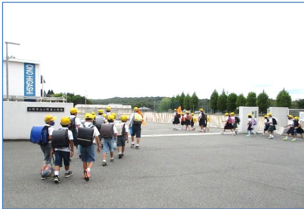
☆挨拶をして登校しています。

3年ぶりに5月開催の運動会を終えることができました。PTA役員をはじめ保護者の皆様のご協力に感謝いたします。6月は、運動会で身に着けた力を元にして、普段の生活や学習を頑張り、学びを蓄える大事な時期です。