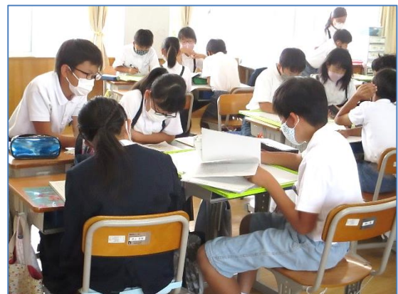
☆友だちと話し合っています。