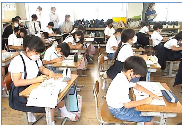
☆自分の考えを書いています。