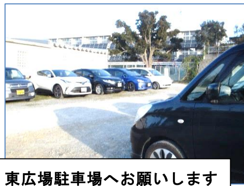
東広場駐車場へお願いします