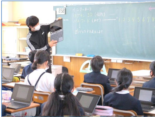
↑ログイン・ログアウトの練習

前頭前野は、学力と心の源です。前頭前野は、音読やスピード計算、対話等で鍛えられます。前頭前野を鍛え、学力を高め、心を育む取組を進めます。