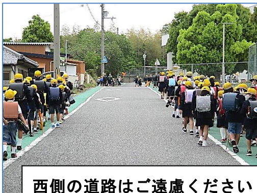
西側の道路はご遠慮ください

送迎の車については、 東広場の駐車場 に回っていただきますようお願いいたします。けがや体調不良等で歩くことが困難な場合を除き、 東広場の駐車場 をご利用ください。