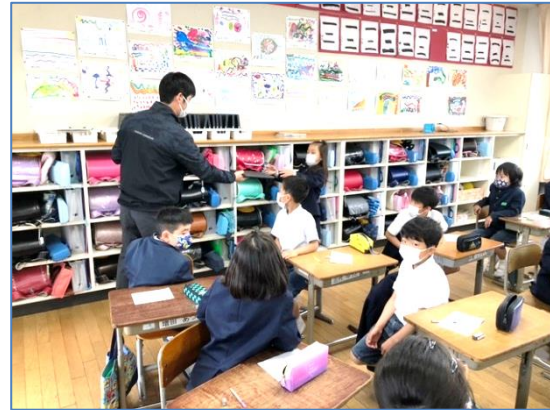
↑一人一台のPC、大切に使います