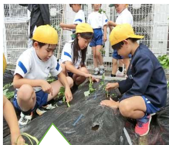
1・2年 サツマイモのつるさし

いよいよ7月。夏真っ盛りとなり、学校では、子どもたちが自然に親しみ、体験を通して生き生きと主体的に学びを進め、豊かな感性を育てています。2年生は、毎朝登校するとすぐに、ペットボトルに水を入れミニトマトの鉢に水かけしています。校舎南の畑では、1・2年生が植えたサツマイモのツルが根付き、新しい葉を次々と繁らせています。3年生は大豆の苗を植え付けました。東条川に稚鮎を放流し、里地探検では、カエル見つけに夢中になり生態について興味をもちました。