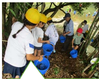
3年 鮎の放流 (東条川 岩ばちこに)

土と水と太陽の光を浴びて、大きくたくましく育っていく生き物や植物たち。開花や結実、収穫までの苦労や喜びを繰り返し体験し、動植物の生長過程を楽しみながら命の尊さを感じ、これから益々子どもたちの興味関心が広がっていくことを願っています。