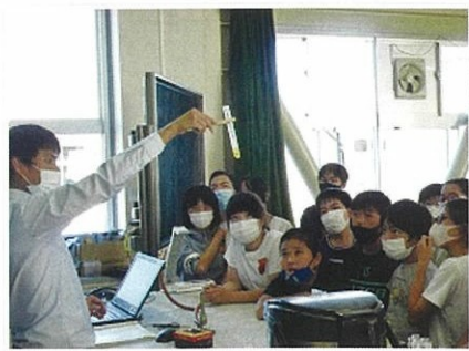
1 日生活体験・理科 (大部)