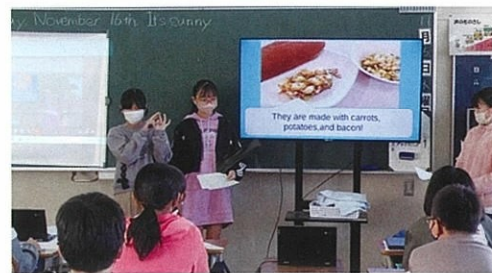
他市とのオンライン交流