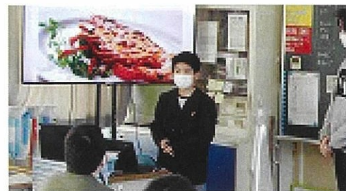
他校 ALT とのオンライン交流