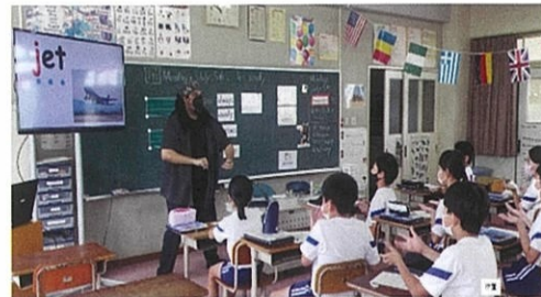
Phonics による発音・文字指導