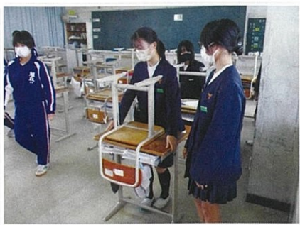
生活交流・掃除 (下東条)