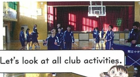
Let's look at all club activities.