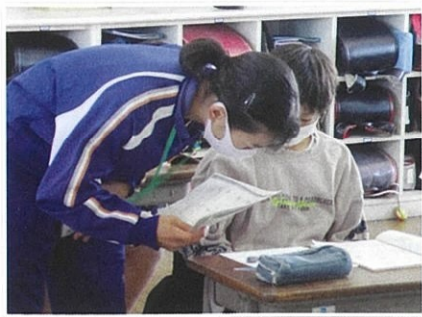
トライやる・ウィーク (中番)